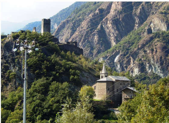
Castello e chiesa di Saint-Germain