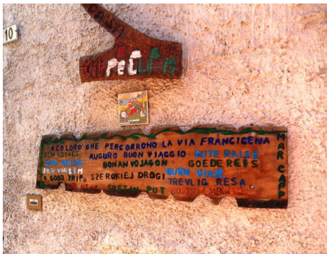
Chandianaz, targa di augurio

poi continuare fino ad arrivare al paese di Chambave, alle ore 16,30, per fermarci un'ultima volta presso la cantina: La Crotta di Vegneron, ed assaggiare il famoso "Moscato di Chambave", ripartendo alle ore 17,30 per l'ultima parte di questa tappa, risalendo fino alla frazione Chandianaz, dove un simpatico pensionato, che abita in una