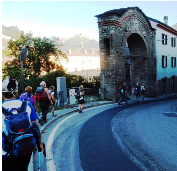
Châtillon, arrivo al paese

casa all'uscita della frazione, ha intagliato delle targhe che augurano buon cammino a tutti i pellegrini che passano sulla Via Francigena, davanti alla sua casa.